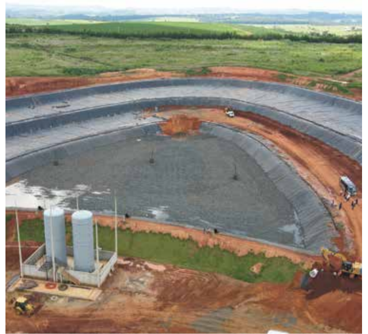
Tributo possibilitou avanço na obra da Central de Tratamento de Resíduos

Além disso, o tributo extinto possibilitou um expressivo avanço na obra da Central de Tratamento de Resíduos (CTR), que já iniciou as suas atividades.