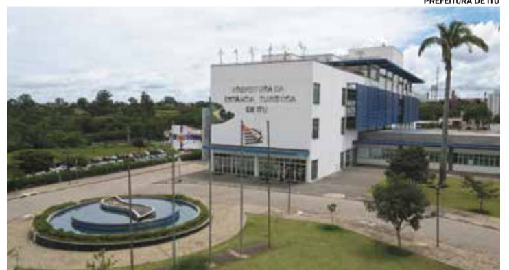
Mudanças obedecem prazo máximo de descompatibilização eleitoral