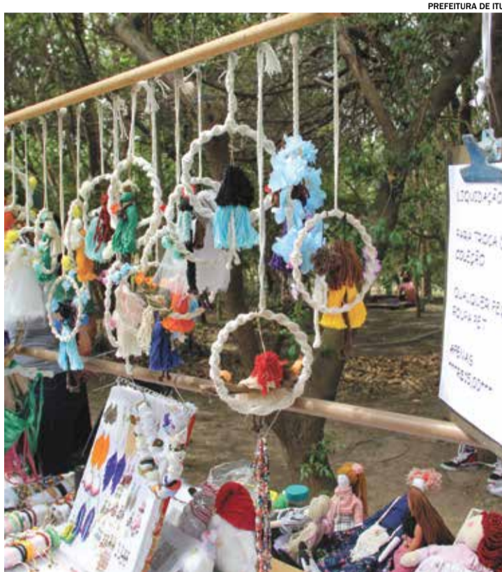
Feira Ecoart no Taboão oferece o melhor do artesanato e da gastronomia

A Feira Ecoart promove o encontro de mais de 100 expositores, oferecendo o melhor do artesanato e da gastronomia, e é uma ação do programa “Itu em suas mãos”, da Prefeitura de Itu, por meio da Secretaria de Cultura e Patrimônio Histórico, em parceria com as Secretarias de Meio Ambiente e de Turismo, Lazer e Eventos, visando promover o fomento da economia cria-