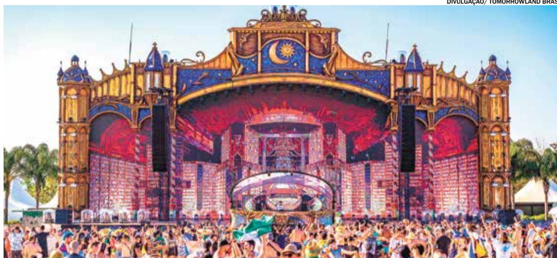
Organização do evento anunciou o início da pré-venda de ingressos para quarta-feira, dia 10, no site oficial

A edição 2024 traz a magia de Adscendo , que significa “ascender”, e se trata de uma viagem por destinos mágicos e grandiosos no horizonte, que contará com um palco de 43m de altura e 160 de largura; 740m 2 de blocos de vidro, sendo 1.517 unidades; 1.050 luzes; 230 caixas de som e subwoofers; 30 lasers; 48 fontes; e 15 cachoeiras.