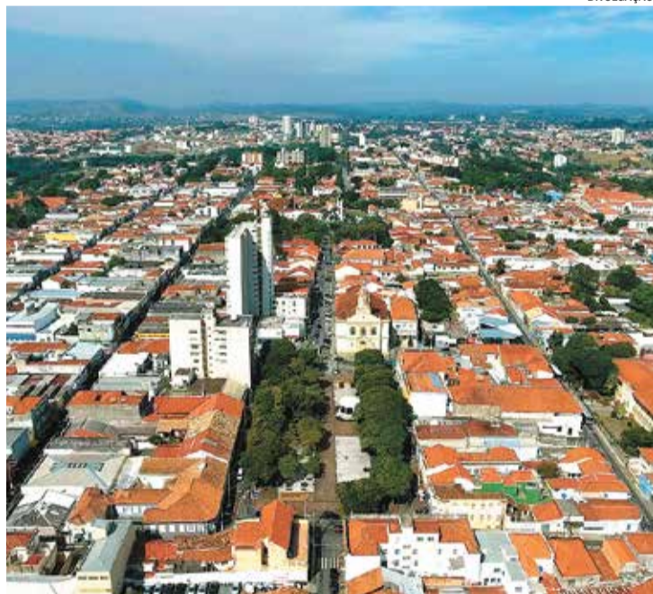
Encontro será realizado no auditório da Secretaria do Meio Ambiente

O auditório da Secretaria do Meio Ambiente está localizado na Avenida Itu 400 anos, 77, Parque Ecológico do Taboão.