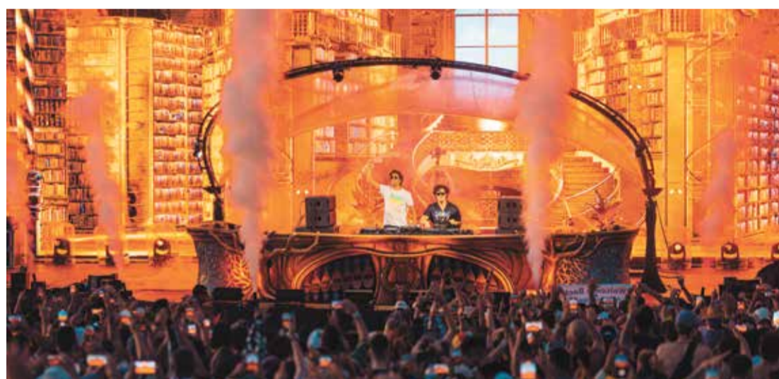
Data foi confirmada em anúncio feito na terça-feira, dia 9, na Sala São Paulo, que reuniu organizadores do evento

Por meio das vendas dos ingressos sociais na edição de 2023, o Tomorrowland Foundation recebeu R$ 1,5 milhão para a realização de projetos sociais com crianças e adolescentes em situação de vulnerabilidade na cidade de Itu. Os projetos, realizados junto com a instituição Tecendo Infâncias, visam o desenvolvimento artístico desses jovens por meio da música, dança e artes plásticas.