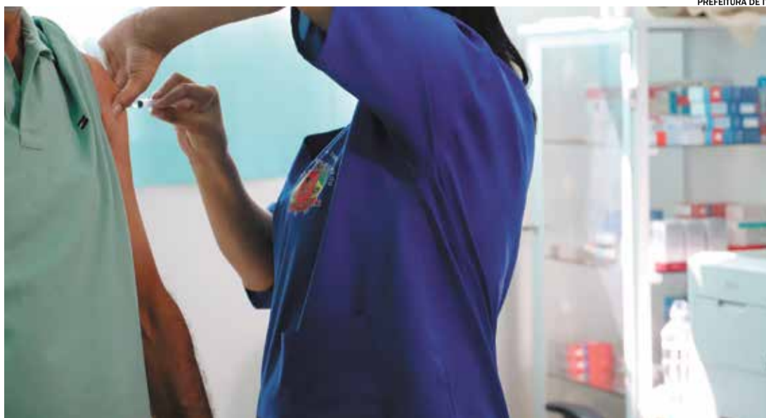
Dia D de Mobilização terá vacinação contra Influenza em todas as Unidades Básicas de Saúde, das 8h às 17h

Podem receber a vacina contra a Gripe (Influenza) os seguintes grupos: crianças de 6 meses a menores de 6 anos (5 anos, 11 meses e 29 dias), trabalhador da saúde (trabalhadores de saúde dos serviços públicos e privados, nos diferentes níveis de complexidade, conforme definição do Ministério da Saúde), gestantes, puérperas (mulheres no período até 45 dias após o parto), professores e trabalhadores de instituição de ensino básico a superior, povos indígenas, povos e comunidades