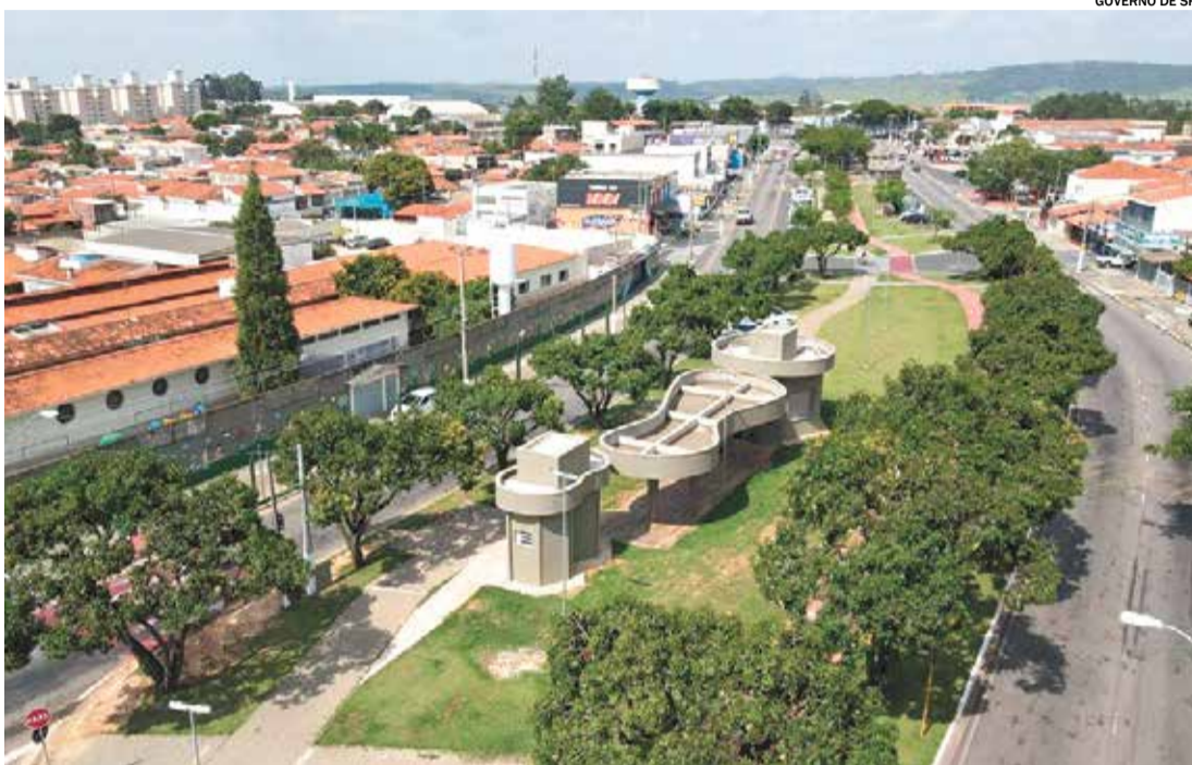
Polo Turístico e Gastronômico de Itu (foto) e espaço Almeida Junior receberam investimento de R$ 7,1 milhões

também teve um impacto positivo na entrega de obras turísticas, com 23 obras prontas, no valor de R$ 38,6 milhões. Destaque para a criação do Polo Turístico e Gastronômi-