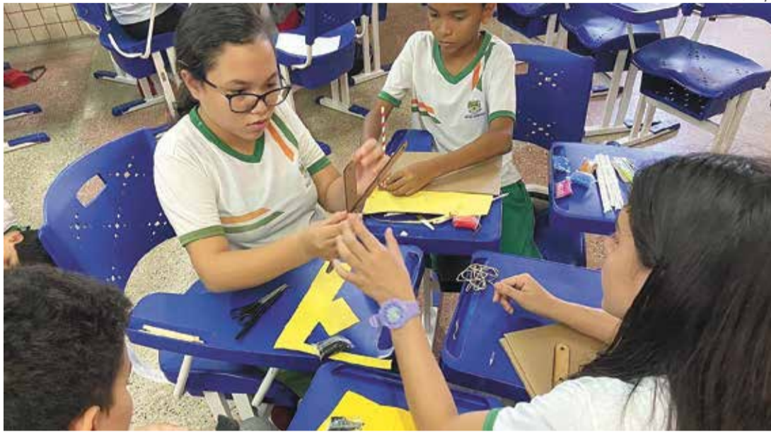
Com ambientes maker, os alunos ficam imersos em experiências tangíveis que transformam a aprendizagem

“A educação já não se limita mais à sala de aula convencional, onde os pro-