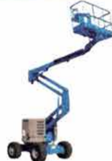
Z45 / 25JRT