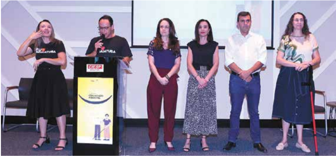
Autoridades na abertura do Summit de Acessibilidade destacaram a importância de comunicação acessível

RAYANE LINS rayanelins@maiseexpressao.com.br