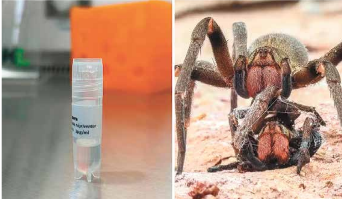
Dados do Inca apontam que, no período entre 2023 e 2025, haverá cerca de 73.610 novos casos de câncer de mama

chamou a atenção de cientistas por conta dos efeitos no sistema nervoso das presas, podendo levar a convulsões, por exemplo.