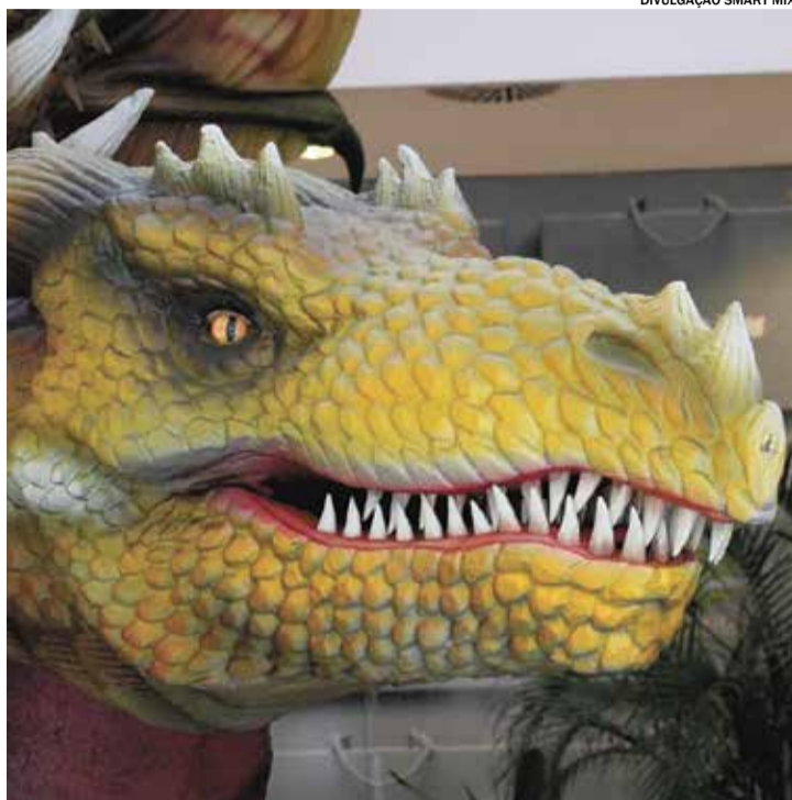
Exposição internacional chega ao Polo Shopping dia 19 de maio

A exposição é composta por 10 réplicas de dragões, sendo que o maior deles chega a medir cinco metros de altura e oito de comprimento. As estruturas são animatrônicas, ou seja, apresentam