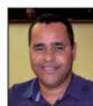
Pepo Lepinsk Pessoa Pública