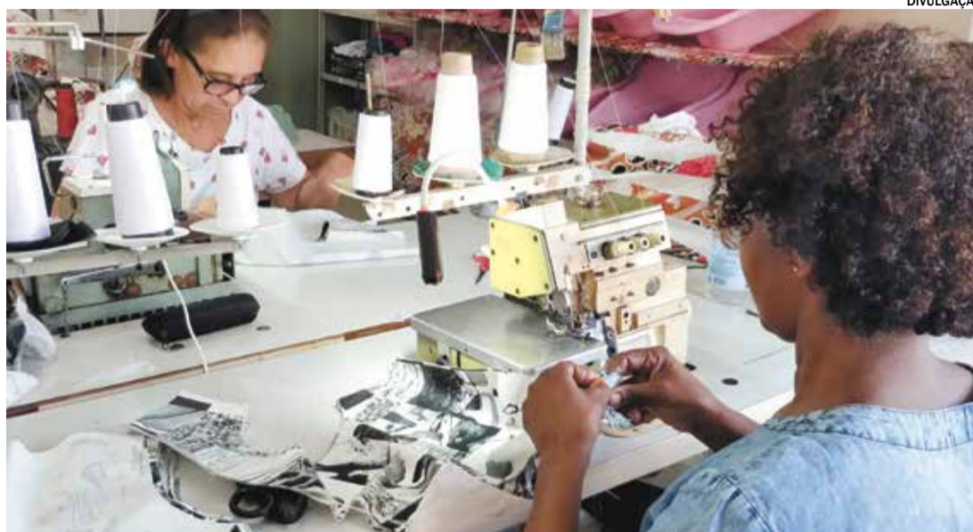
Oficinas gratuitas de Corte e Costura tem o objetivo de empoderar as mulheres da comunidade

Com o incentivo da empresa Irani Papel e Embalagem, uma das principais indústrias de papel e embalagens sustentáveis do Brasil, a partir do dia 28 de Maio, a Nanquin Cultura e Arte estará oferecendo oficinas de Corte e Costura especialmente voltadas para as mulheres do Bairro Morada do Sol. Estas oficinas incluirão tanto aspectos teóricos quanto práticos, abrangendo desde os fundamentos básicos até técnicas avançadas.