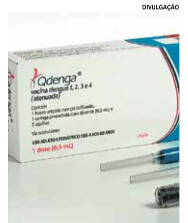
A vacina teve seu registro na Anvisa

Em nota, a OMS define a Qdenga como uma vacina viva atenuada que contém versões enfraquecidas dos quatro sorotipos do vírus causador da dengue. A organização recomenda que a dose seja aplicada em crianças e adolescentes de 6 a 16 anos em locais com alta transmissão de dengue. Ainda de acordo com a OMS, a Qdenga deve ser administrada em esquema de duas doses com intervalo de três meses entre elas – mesmo esquema vacinal atualmente adotado no Brasil. O imunizante teve seu registro aprovado pela Agência Nacional de Vigilância Sanitária (Anvisa).