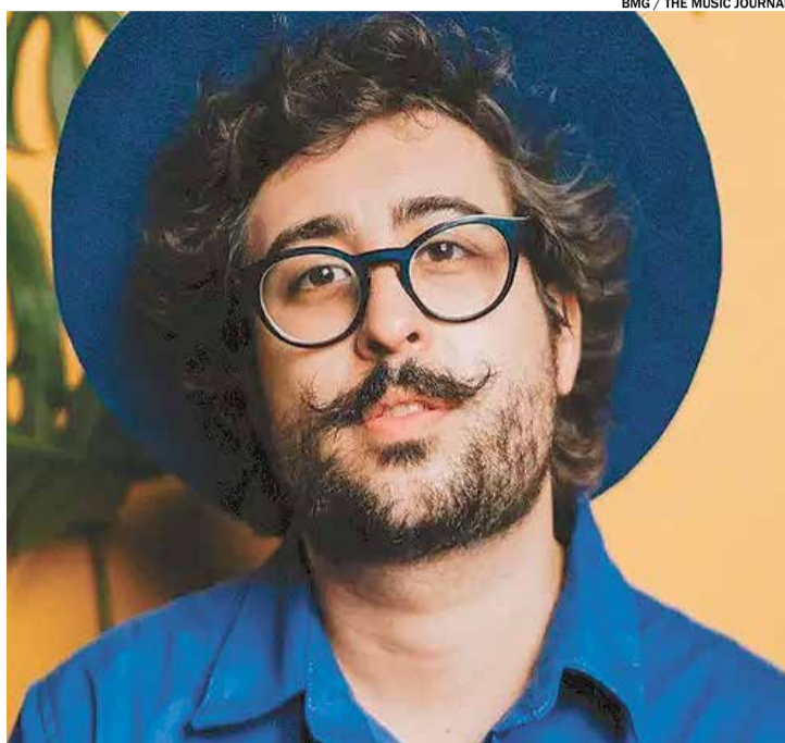
BMG / THE MUSIC JOURNAL