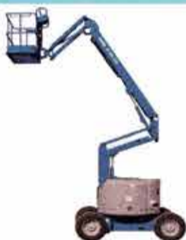
Z34 / 22DC