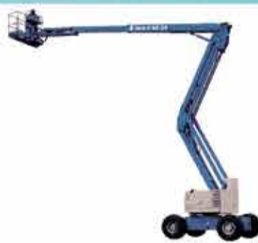
Z60 / 34

AGILIZE SUA OBRA E ECONOMIZE NO ORÇAMENTO.