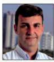
Nilson Alcides Gaspar Prefeito