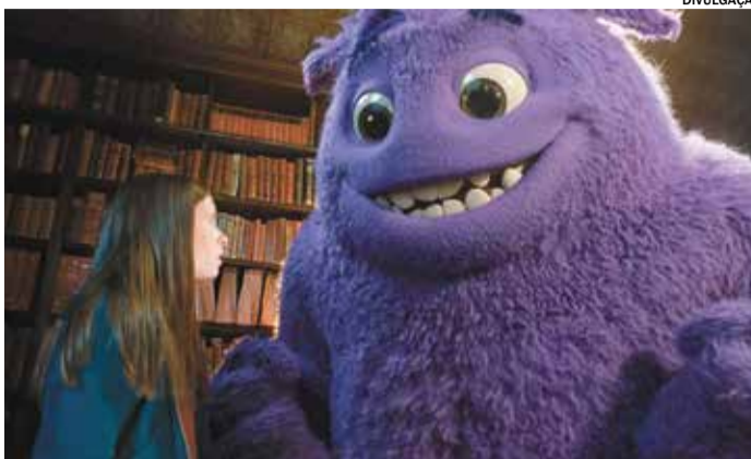
AMIGOS IMAGINÁRIOS - Uma garota que adquire a habilidade de ver os amigos imaginários de todas as pessoas após sofrer um evento traumático