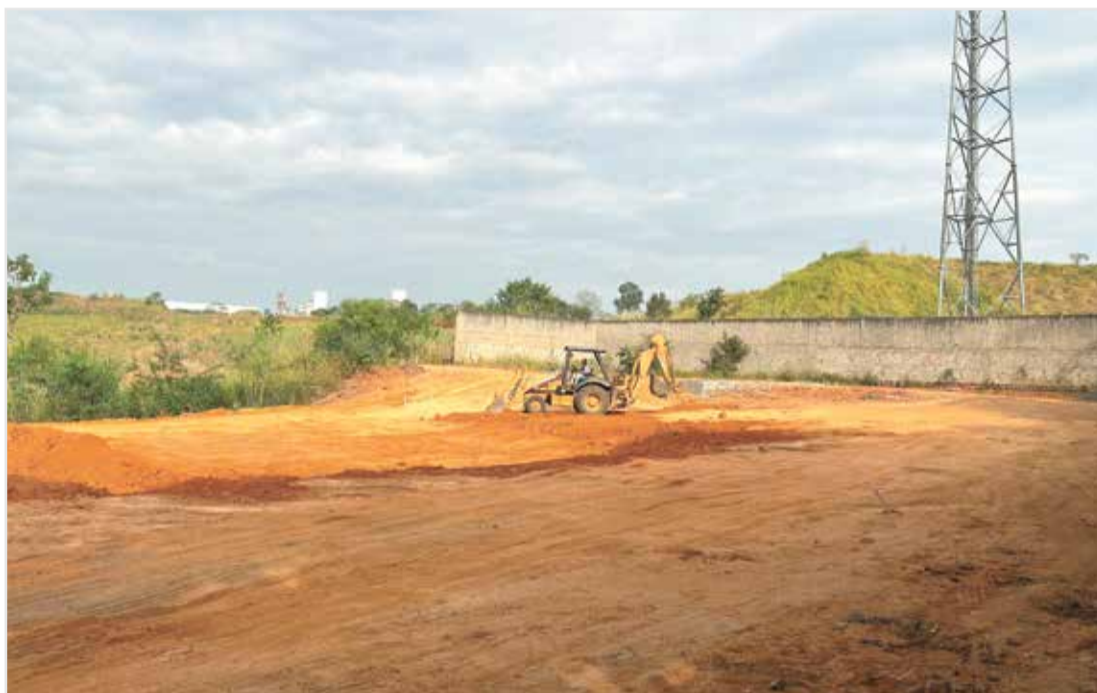
Terreno no Jardim Oliveira Camargo é preparado para receber obra da quadra poliesportiva

A área onde ficará a quadra está localizada na esquina da rua Carolina Tempesta Gonçalves com a rua Manoel Francisco Ribeira Garcia, e acordo com o projeto da Engenharia, a quadra será construída com piso arma-