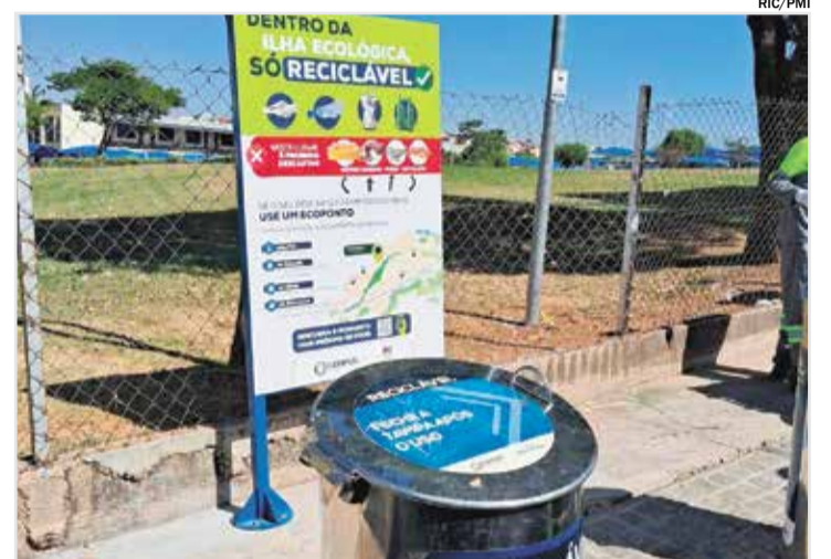
Ilhas de coleta seletiva da cidade recebem placas de conscientização

Os Ecoportos estão em quatro endereços: Jardim Nova Veneza, na rua Padre Arthur Lupurini Sampaio, esquina com rua José Vilalta; Jardim João Pioli, localizado