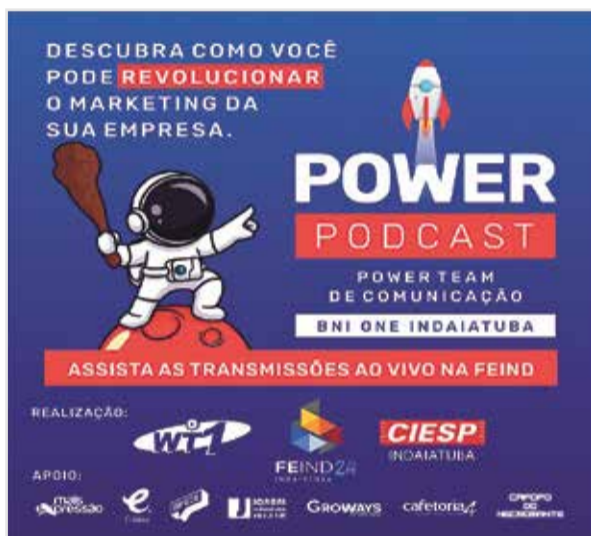
Do dia 21 a 23 de maio acontece a FEIND 2024 feira das Indústrias em Indaiatuba, no espaço da Viber e o Power Team da Comunicação do BNI ONE estará presente em um Stand com o Power Podcast com transmissão ao vivo!!