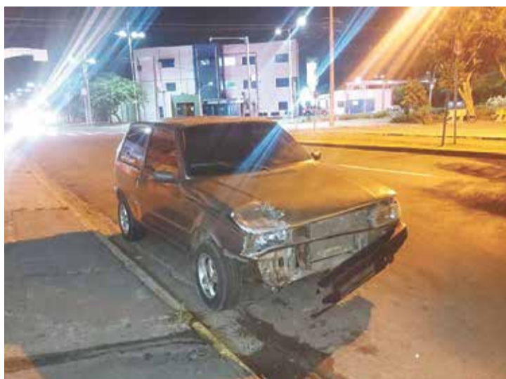
A vítima chegou a ser socorrida mas não resistiu aos ferimentos e morreu