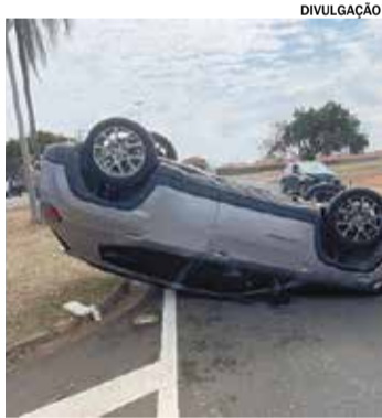
A colisão resultou no capotamento do Compass, que acabou parando com as rodas para cima

Um carro capotou, após outro veículo invadir a preferencial de uma rotatória entre as ruas Alameda José Cardeal e Avenida Nove de Dezembro, no bairro Jardim Pedroso. A batida ocorreu no início da tarde de terça-feira (14).