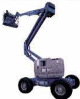
Z45 / 25JDC