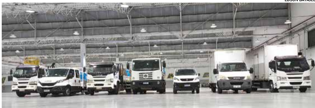
Dez caminhões carregados com as doações, realizadas no SOS Rio Grande do Sul, foram destinados ao estado

Pontos de coleta: ACM-TI Terras de Itaici, The Cleaver Burger, Pindukas Chopp Bar, Nudy Store, Bloco 2, Kuia Gourmet, Re-